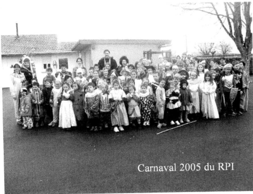
Carnaval 2005 du RPI