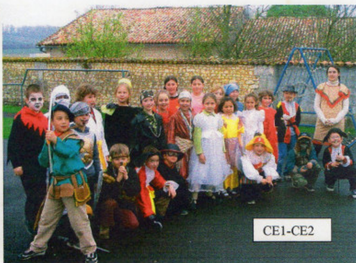
Le carnaval 2005