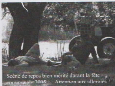
Scène de repos bien mérité durant la fête communale 2005. Attention aux allergies !

Le printemps s'annonce enfin, synonyme de balades en forêt, déjeuner sur l'herbe... Mais pour certains cette période annonce aussi le retour d'un « rhume des foins » qui peut durer jusqu'à l'automne.