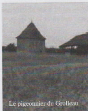
Le pigeonnier du Grolleau